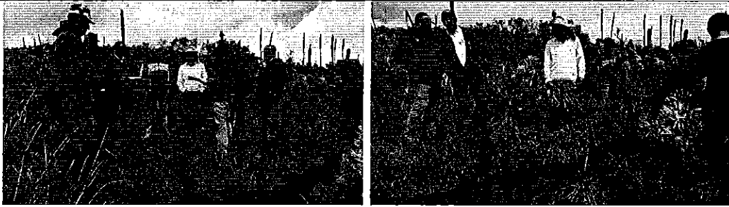
Fotografía 1. Reunión de trabajo e inspección técnica con los miembros de la Junta de Riego Santa Bárbara de Car