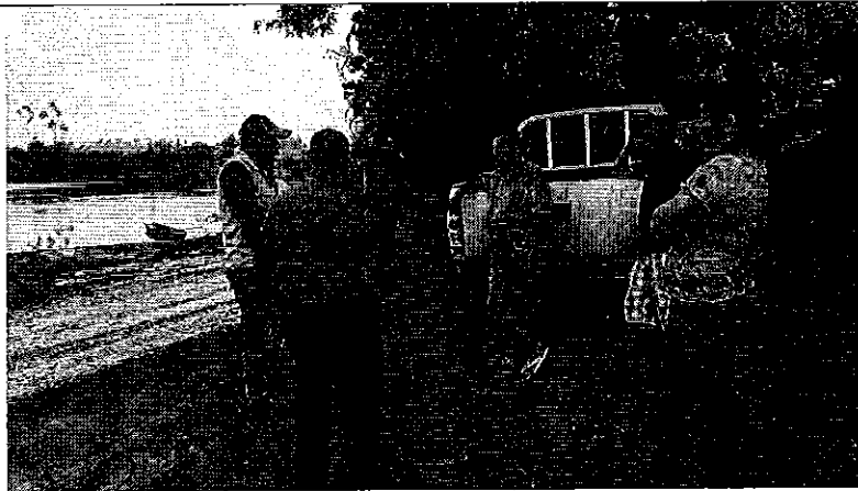
Fotografía 1: Conversatorio con GADM Mocache (denunciado) y los representantes de la Cooperativa de Producción Pesquera Artesanal "ODISEA".