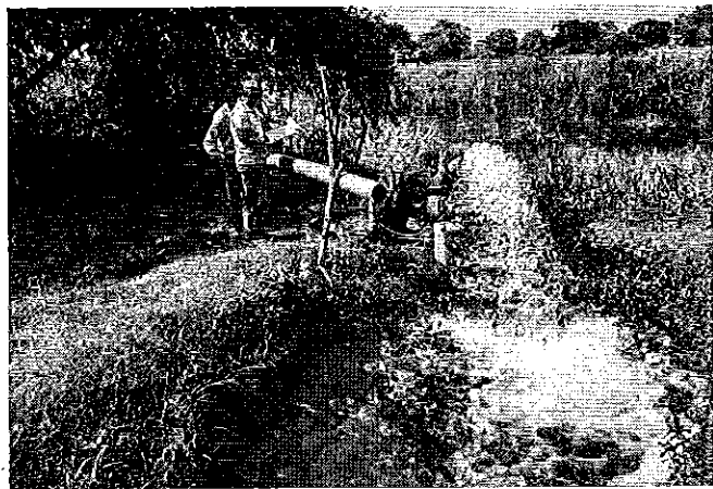
Fotografía 2. Visita técnica y recorrido por las fuentes hídricas y al canal de conducción de la Junta de Riego y Drenaje Cocal - Pechichal