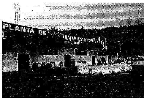
Fotografía 1. EAPA San Mateo.