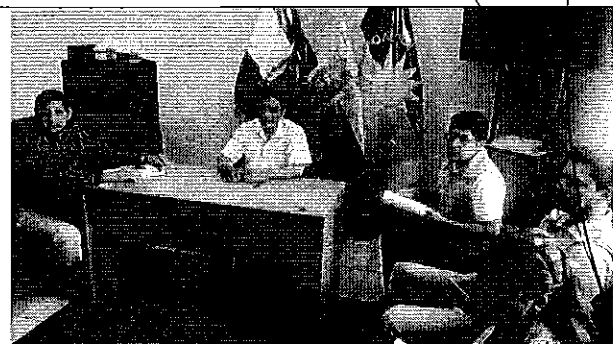
Ilustración 1. Reunión con los representantes del GADM de Montalvo.