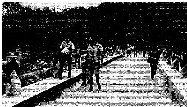
Ilustración 2. Verificación del funcionamiento de la infraestructura con los representantes del GADM de Montalvo.