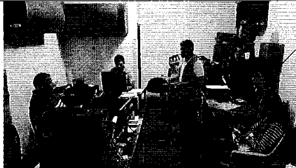
Ilustración 5. Reunión con funcionarios del GADM y la ciudadanía que presentó el escrito a la ARCA.