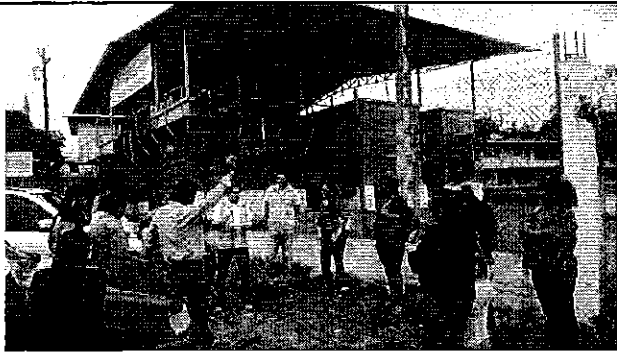
Ilustración 3. Reunión con los representantes de la ciudadanía del GADM de Montalvo.