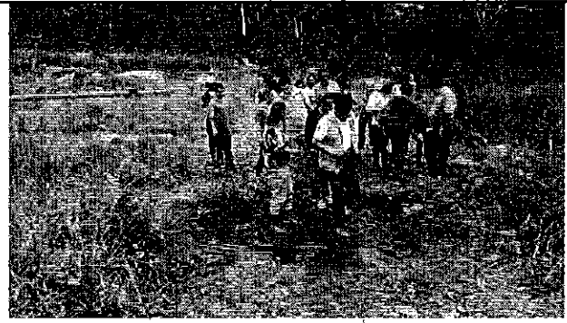
Ilustración 4. Verificación del funcionamiento de la infraestructura con los representantes de la ciudadanía del GADM de Montalvo.