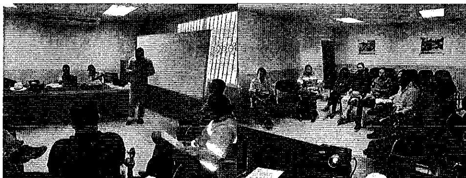
Fotografía 2. Reunión de trabajo con representantes de instituciones públicas invitadas.