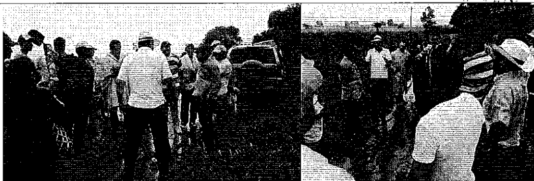
Fotografía 3. Inspección en el estero Yumes - Colimes