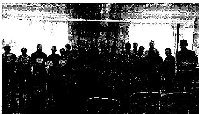
Ilustración 6. Entrega de certificados de asistencias a los talleres.