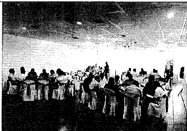
Ilustración 5. Conformación de mesas técnicas con los prestadores públicos de la DH de Guayas.