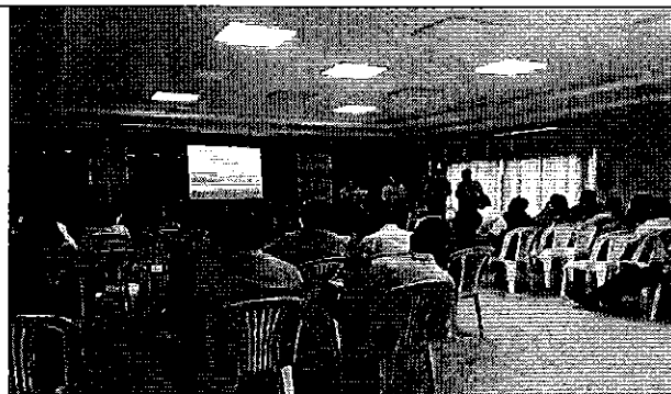
Ilustración 2. Presentación de los resultados de las mesas técnicas de los prestadores públicos de la DH de Manabí