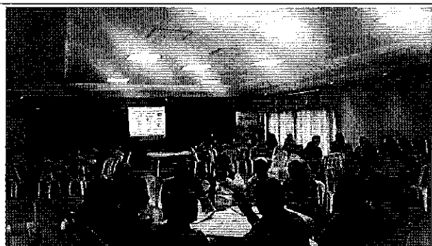
Ilustración 1. Conformación de mesas técnicas con los prestadores comunitarios de la DH de Manabí.