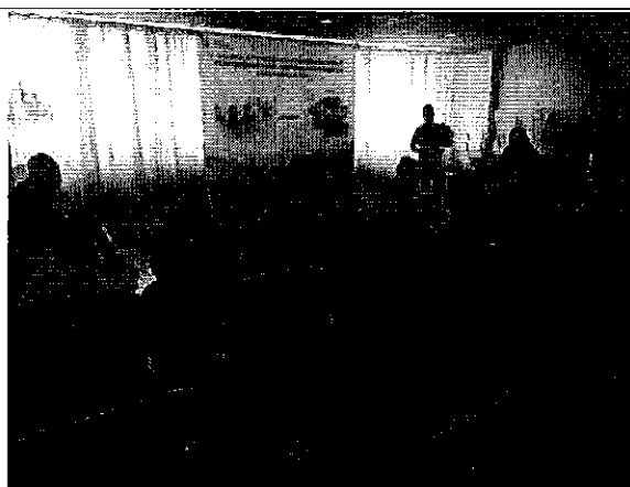
Ilustración 4. Presentación de los resultados de las mesas técnicas de los prestadores comunitarios de la DH de Guayas.