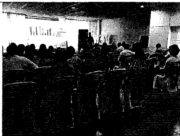
Ilustración 3. Difusión de la Regulación Nro. DIR-ARCA-RG-006-2017 a los representantes de los GADMs de la DH de Guayas.