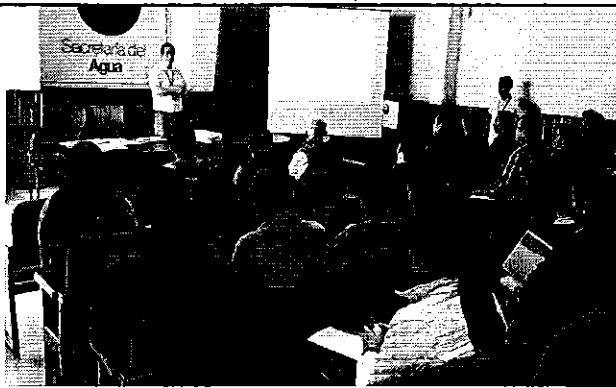
Ilustración 5. Presentación de la Expost a los representantes de los GADMs de la DH Pastaza, sobre la Regulación Nro. DIR-ARCA-RG-003-2016.