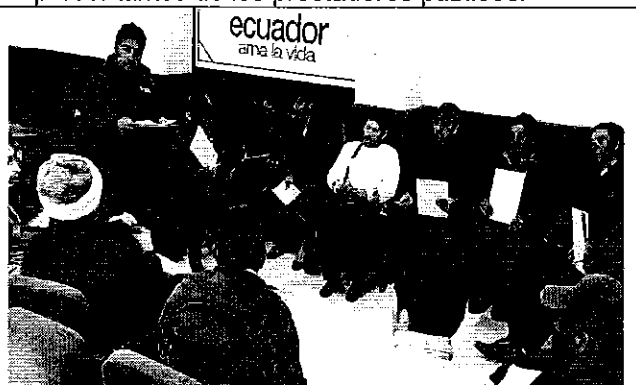
Ilustración 8. Mesa técnica para el análisis de la posible reforma de los parámetros e indicadores de la Regulación Nro. DIR-ARCA-RG-003-2016 con los representantes de los prestadores comunitarios.