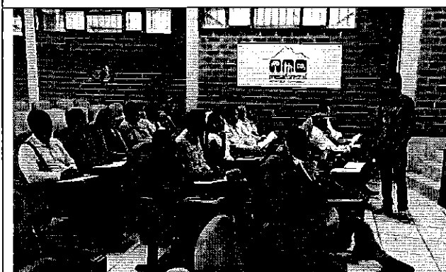
Ilustración 3. Presentación del contenido de la Regulación Nro. DIR-ARCA-RG-003-2016 a los representantes de los prestadores comunitarios de la DH Napo.