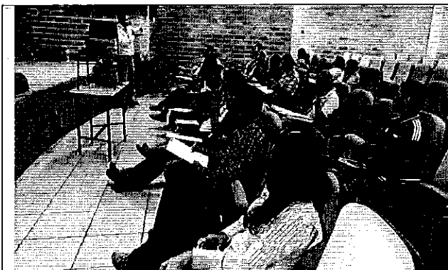
Ilustración 1. Presentación de la Expost a los representantes de los GADMs de la DH Napo, sobre la Regulación Nro. DIR-ARCA-RG-003-2016.