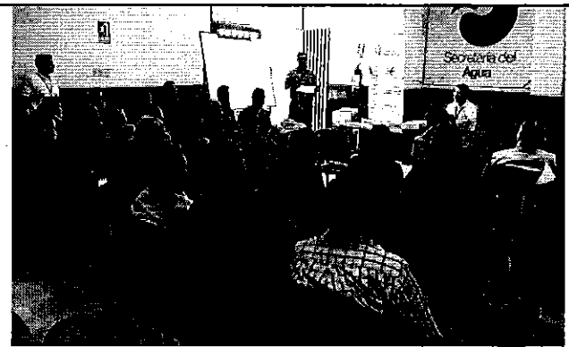
Ilustración 6. Mesa técnica para el análisis de la posible reforma de los parámetros e indicadores de la Regulación Nro. DIR-ARCA-RG-003-2016 con los representantes de los prestadores públicos.