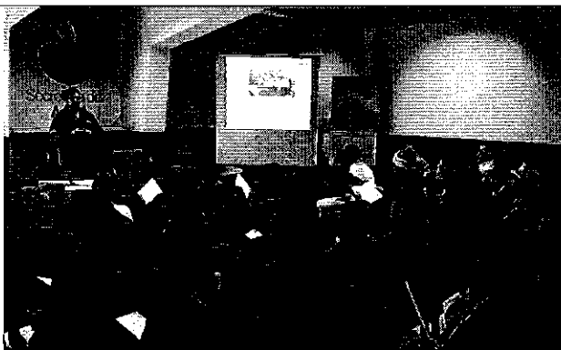
Ilustración 7. Presentación del contenido de la Regulación Nro. DIR-ARCA-RG-003-2016 a los representantes de los prestadores comunitarios de la DH Pastaza.