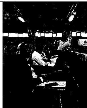
Ilustración 2. Mesa técnica para el análisis de la posible reforma de los parámetros e indicadores de la Regulación Nro. DIR-ARCA-RG-003-2016 con los representantes de los prestadores públicos.