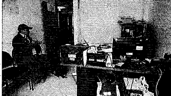
Fotografía 2. Reunión de trabajo con el responsable Técnico del CAC- Alausí