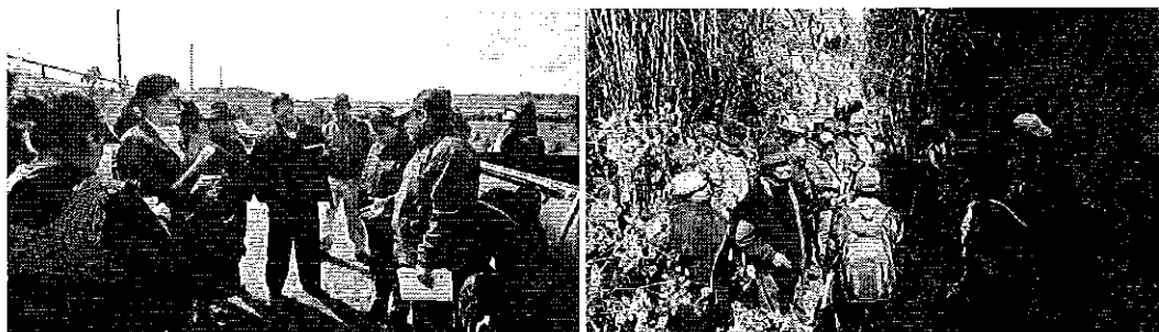
Fotografía 1. Reunión de trabajo e inspección técnica en la Quebrada "Chaupiyaku"