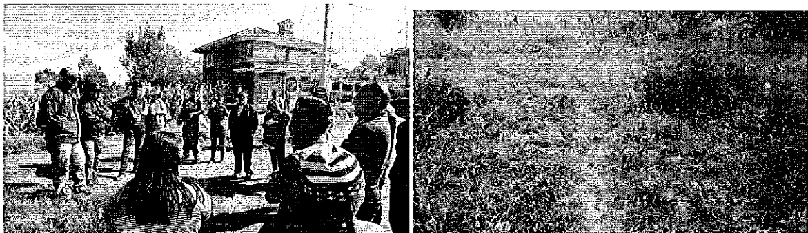
Fotografía 3. Reunión de trabajo e inspección técnica en la parroquia de Paccha.