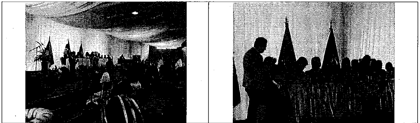
Ilustración 1. Inicio del evento por parte del Alcalde del GADM de Santo Domingo.