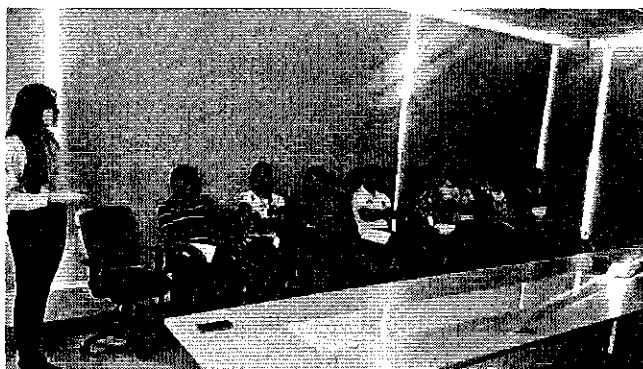
Fotografías. Difusión de las competencias y regulaciones emitidas