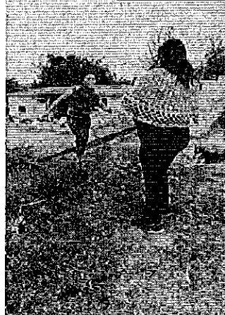
Fotografía 1. Entrega de Invitaciones – Provincia de Imbabura