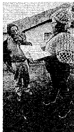
Fotografía 2. Entrega de Invitaciones – Provincia del Carchi