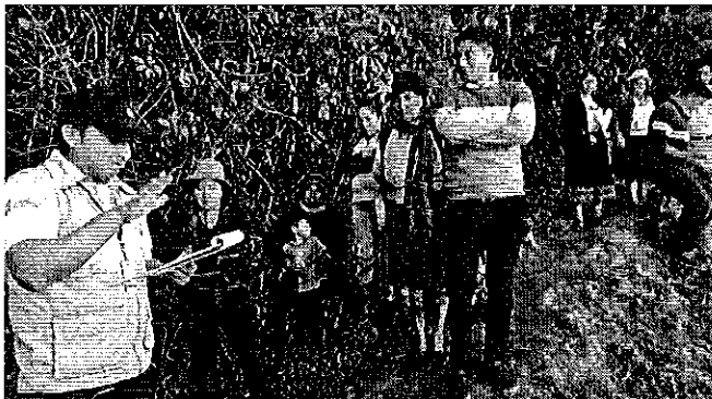
Fotografía 1. Inspección Técnica sector Tuncay, parroquia Asunción, cantón Girón Provincia del Azuay.