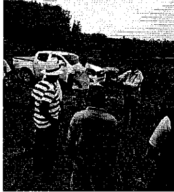
Fotografía 2. Inspección Técnica sector Abras de Mantequilla, parroquia Guare cantón Baba Provincia de Los Ríos.