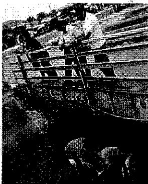
Fotografía 2. Practicas en campo: Fortalecimiento de capacidades al personal técnico de la oficina de la ARCA de Portoviejo.