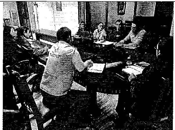
Ilustración 2. Reunión de planificación con el GADM de Alausí