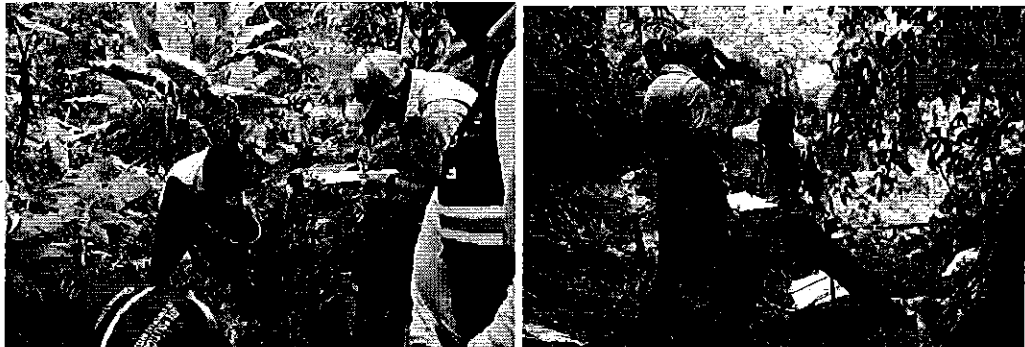
Fotografía 1,2. Inspección en el cantón Las Naves