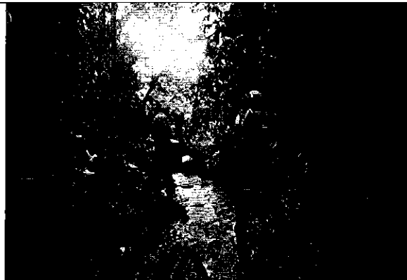
Fotografía 3. Toma de datos en territorio