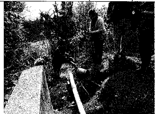
Fotografía 4. Taller de Fortalecimiento a los prestadores comunitarios –recorrido en campo (23-02-2023)