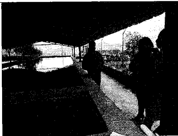
Fotografía 5. Control GADM de Chambo, recorrido en campo, sistema de agua potable (24-02-2023)