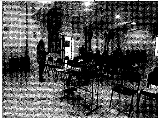
Fotografía 3. Taller de Fortalecimiento a los prestadores comunitarios del cantón Chambo (23-02-2023)