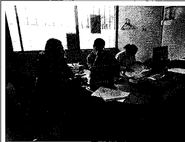
Fotografía 1. Control GADM de Chambo (22-02-2023)