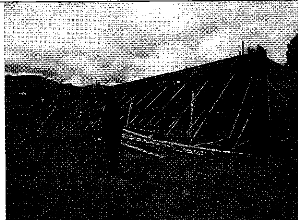
Fotografía 5. Control GADM de Chambo, recorrido en campo, sistema de alcantarillado (24-02-2023)