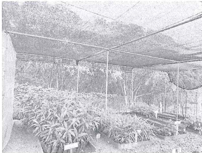
Revisión de plan de reforestación