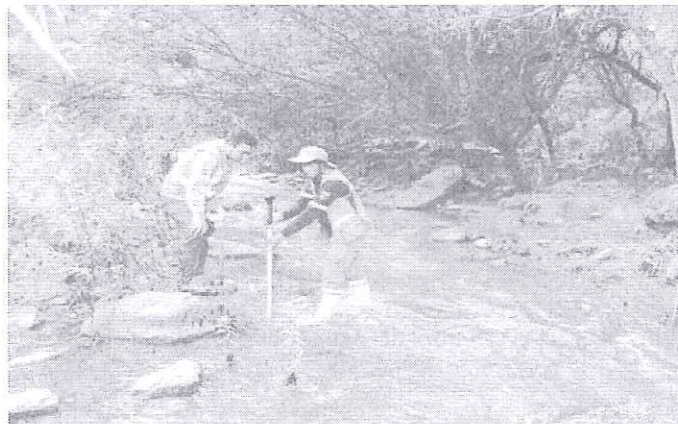
Aforamiento de caudales