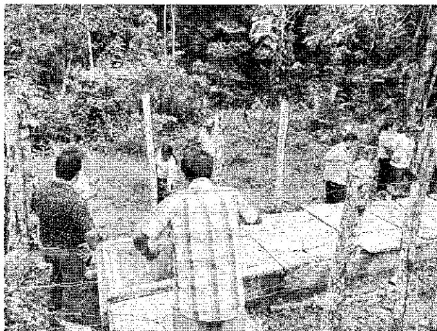
Reunión con los prestadores comunitarios del GADM y reunión final