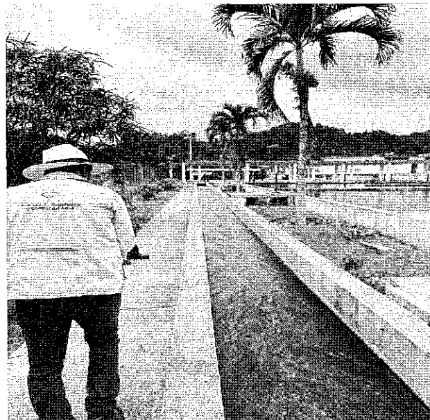
Control de las obligaciones establecidas en la autorización de agua