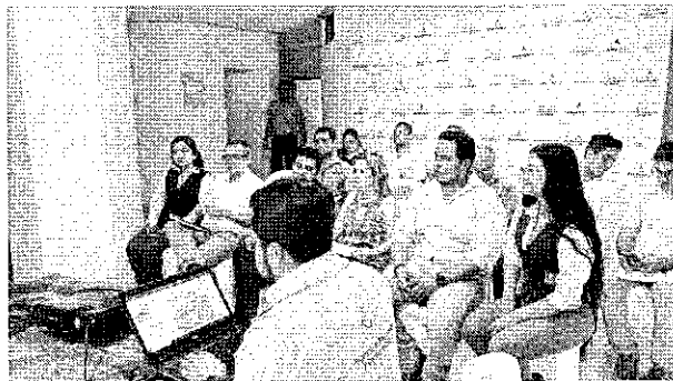
Exposición y reunión inicial con el personal de la EMAPA EP y GADM