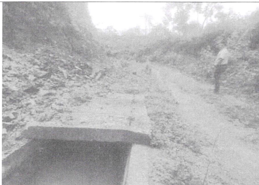
Canal de riego, existencia de embaulado sector El Pitayo