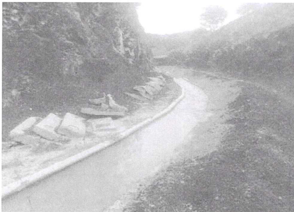
Canal de Riego sector Garza Real, tapas del embaulado levantado