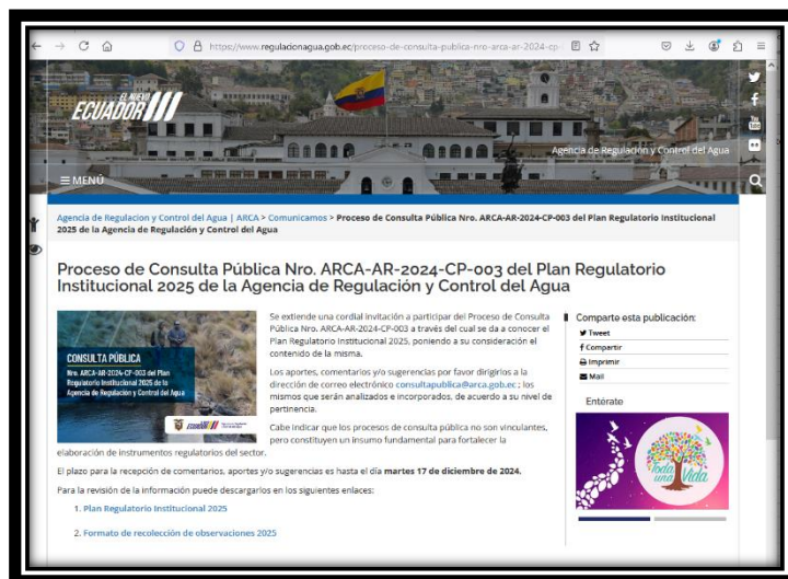
Ilustración 1. Publicación en página web institucional.

De acuerdo a la planificación aprobada, se realizó la publicación del proceso de consulta pública, en la página web institucional, tal como se muestra en la Ilustración 1.